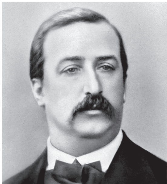
Александр Порфирьевич Бородин

Ключевые слова: А.П. Бородин, русская музыкальная классика, патриотическое воспитание, «Могучая кучка», опера, симфония, детское восприятие музыки.